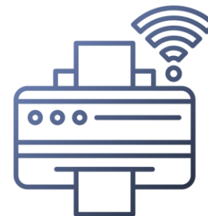
Получение ЭМ по сети Интернет, печать и сканирование в аудитории